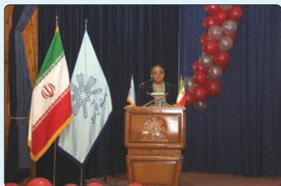
همایش زمین ۴۷ ساله در سالن شهید خودسیانی دانشگاه محقق اردبیلی برگزار شد.

به گزارش روابط عمومی و بین الملل دانشگاه، پروفیسور گودرز صادقی در این همایش گفت: در حالی که در کره های دیگر به دنبال آب و حیات می گردیم که عالی ترین مظاهر زیبایی را در کره خاکی خودمان ناجوان مردانه نشانه گرفته و نابود می کنیم.