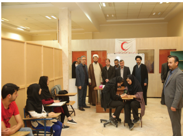
چرم‌دوزی، سفالگری، قلم‌زنی، فتوشاپ، ویراستاری، خوشنویسی، کمک‌های اولیه، بازیگری، کارگردانی و آموزش نرم‌افزارهای کاربردی است. فنی اصل با بیان اینکه معاونت فرهنگی و اجتماعی دانشگاه محقق اردبیلی در راستای پرورش و تقویت استعدادها و مهارت محور دانشجویان شعار «هر دانشجویی، یک مهارت» را محور برنامه‌های خود قرار داده است، افزود: برگزاری دوره‌های مهارتی در کنار تحصیل دانشجویان می‌تواند بستر مناسبی را

معاون فرهنگی و اجتماعی دانشگاه محقق اردبیلی خاطر نشان کرد: در حال حاضر بیش از ۶۰۰ نفر از دانشجویان دانشگاه در این دوره‌ها در حال مهارت‌آموزی هستند.