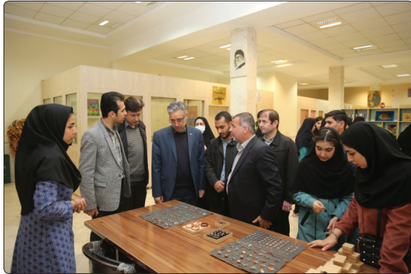
فانرالتحصیلی می‌باشد. سودآور باشد، افزود: در طی برگزاری وی با اشاره به اینکه تولیدات دوره‌های مهارت افزایی، دانشجویان دانشجویی باید کارآفرین و در عین حال زیادی توسط کانون‌های فرهنگی خواهد بود.

شایان ذکر است این بازارچه هر هفته روزهای سه‌شنبه به صورت مستمر در محل کانون‌های فرهنگی و هنری دانشگاه واقع در ساختمان آیت‌الله مشکینی دایر خواهد بود.