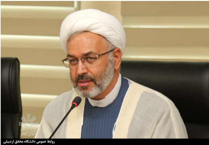
روابط عمومی دانشگاه محقق اردبیلی

مسئول نهاد نمایندگی مقام معظم رهبری در دانشگاه محقق اردبیلی در پیامی به مناسبت آغاز سالتحصیلی ۱۴۰۴-۱۴۰۳ به نقش تاریخی دانشگاهیان در باز کردن گره‌های زندگی ملت و مملکت تاکید کرد.