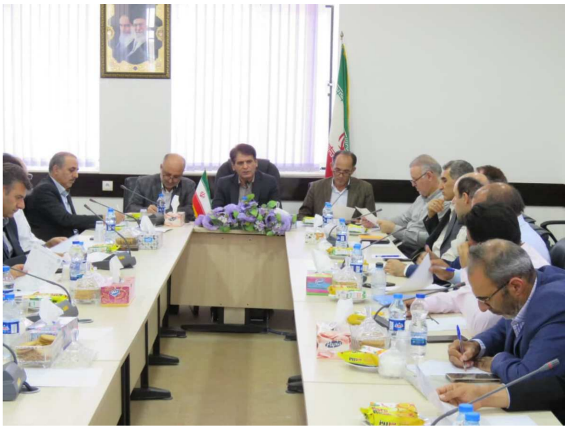
معاون فرهنگی و اجتماعی دانشگاه محقق اردبیلی خبر داد:

معاون پژوهش و فناوری دانشگاه محقق اردبیلی گفت: دانشگاه محقق اردبیلی می تواند بازوی تحقیقاتی و علمی مناسبی برای سازمان جهاد کشاورزی و مرکز تحقیقات کشاورزی باشد.