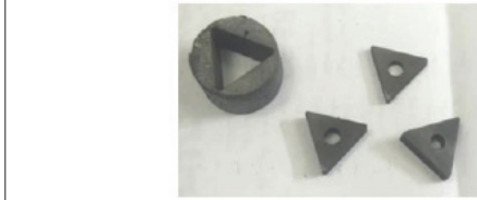
چند لبه ماشینکاری ساخته شده از جنس کامپوزیت بوریدی-کاربیدی-نیتريدی

عضو هیات علمی دانشگاه محقق اردبیلی ادامه داد: با توجه به مواد اولیه به‌کاررفته و فرآیندهای ساخت پیچیده و پرهزینه، ابزارهای فوق سخت بسیار گران هستند و تنها در کاربرهای ویژه به کار می‌روند که در سال‌های اخیر، کوشش‌هایی برای به کارگیری مواد یا فرآیندهای نوین برای ساخت ابزارهای فوق سخت با هزینه تمام‌شده کمتر انجام گرفته است که منجر به توسعه ابزارهای برش کامپوزیتی شده است.