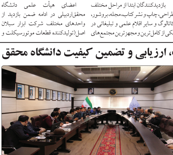
وی افزود: در نیمسال اول سال تحصیلی ۹۸-۱۳۹۷ بیش از ۹۵ درصد دانشجویان اقدام به ارزشیابی

بازدیدکنندگان ابتدا از مراحل مختلف طراحی، چاپ و نشر کتاب، مجله، بروشور، کاتالوگ و سایر اقلام علمی و تبلیغاتی در یکی از کامل‌ترین و مجهزترین مجتمع‌های چاپ و نشر شیران نگار» و «ابزار سلان اصل» بازدید نمودند. اعضای هیات علمی دانشگاه محقق اردبیلی در ادامه ضمن بازدید از واحدهای مختلف شرکت ابزار سلان اصل (تولیدکننده قطعات موتورسیکلت و