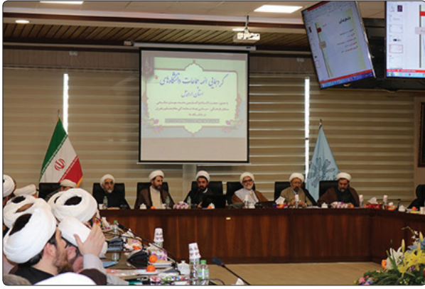
امیرالمؤمنین حضرت علی بن ابیطالب (ع) شده‌اند تا رشادتهای تاریخی را بیافرینند.

وی با تأکید بر تبلیغ چهره به چهره و اهمیت تأثیر آن، تصریح کرد: ما باید به‌عنوان پدر معنوی دستگیر و کمک‌کار جوانان باشیم.