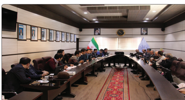
وی افزود: در نیمسال اول سال تحصیلی ۹۸-۱۳۹۷ بیش از ۹۵ درصد دانشجویان اقدام به ارزشیابی

از ۷۹ درصدی دانشجویان انجام پذیرفت. گفتنی است در این نشست اعضای شورای نظارت، ارزیابی و تضمین کیفیت دانشگاه به بررسی و تبادل نظر در خصوص فرایند ارزشیابی اساتید، راهنمای مقاطع تحصیلات تکمیلی و ارزیابی عملکرد کارکنان حوزه آموزش دانشکده‌ها توسط دانشجویان و همچنین ارزیابی درونی و تدوین برنامه‌های بهبود کیفیت گروه‌های آموزشی دانشگاه پرداختند.