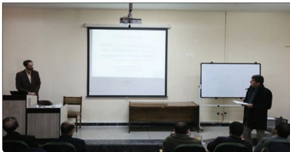
دیدگاه فیزیولوژیک، مورفولوژیک، بیوشیمیایی و مولکولی» با موفقیت